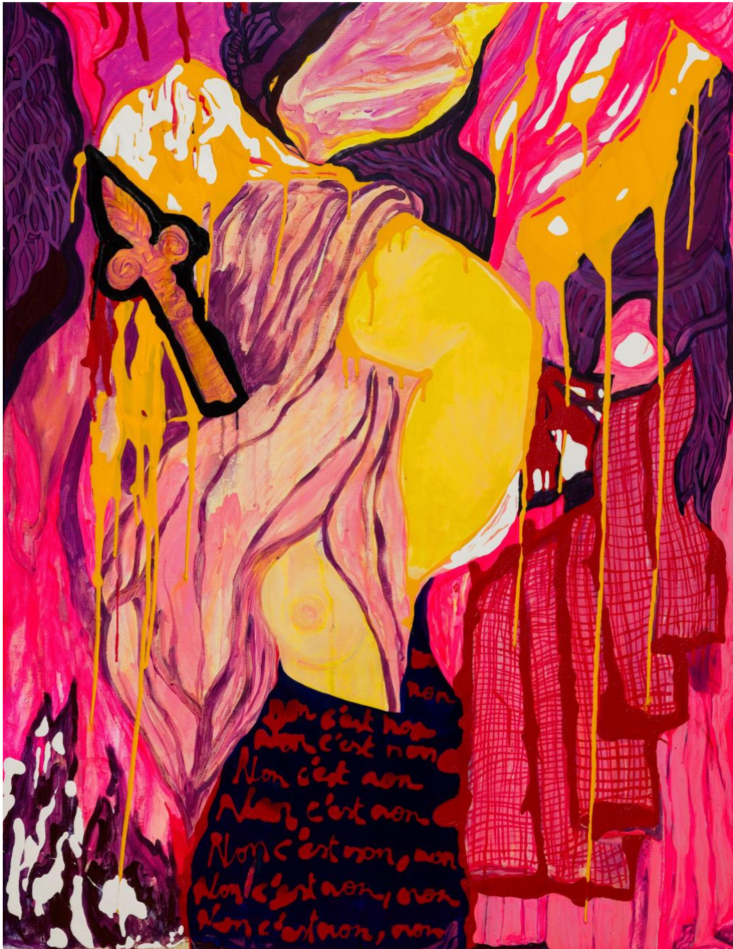
Zoulikha Bouabdellah Le refus de la nymphe , 2023 Acrylique et laque sur toile 122 x 94 cm

© Adagp, Paris, 2024. Crédit photo Romain Darnaud