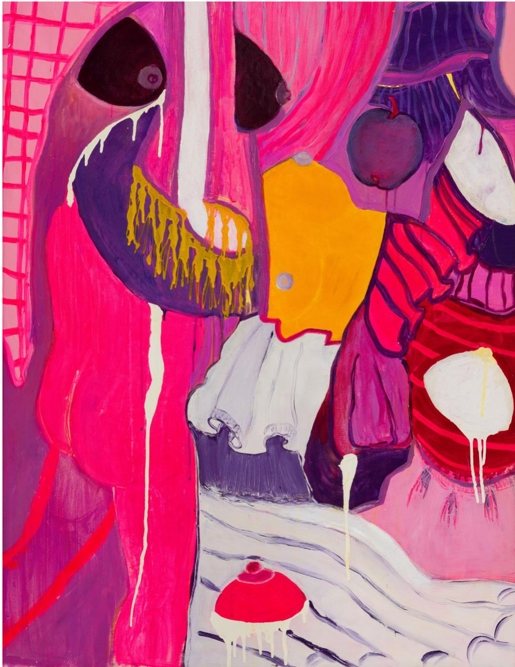
Zoulikha Bouabdellah Le sein de Diane , 2023 Acrylique et laque sur toile 122 x 94 cm

© Adagp, Paris, 2024. Crédit photo Romain Darnaud