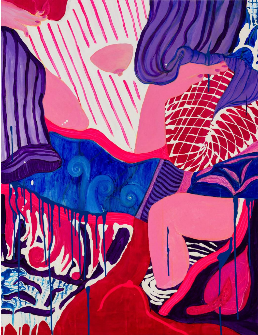
Zoulikha Bouabdellah Le bain de Téthys , 2023 Acrylique et laque sur toile 122 x 94 cm

© Adagp, Paris, 2024. Crédit photo Romain Darnaud